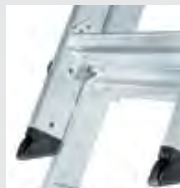
Beschläge zur Arretierung