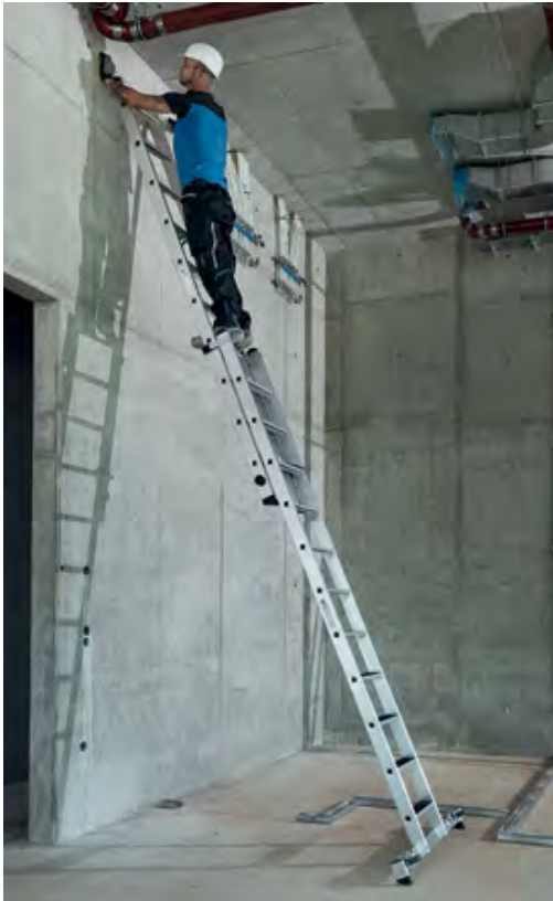
Abb. Bestell-Nr. 40676