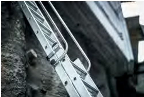
Abb. Bestell-Nr. 30296-30297 (Handlauf steckbar)