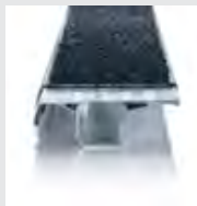
Trittauflagen clip-step R 13