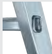
4-fach gebördelte Stufen-/ Holmverbindung